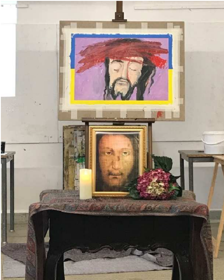
Das fertige „Schweiß Tuch“ mit dem Volto Santo davor.